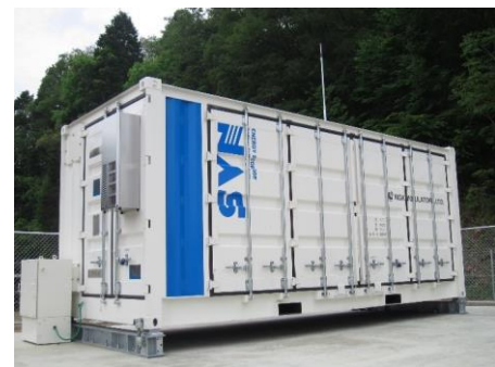
吉田発電所内に設置された 恵那電力のNAS電池