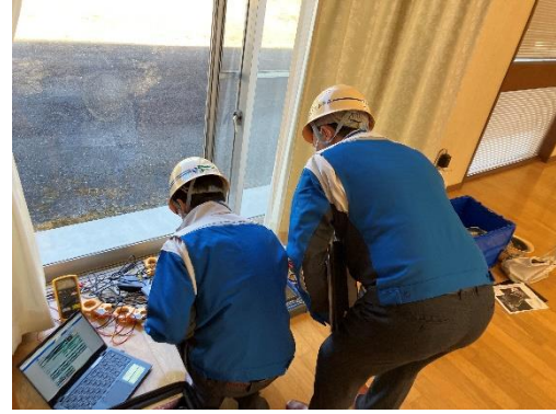
地域マイクログリッド発動試験時の様子