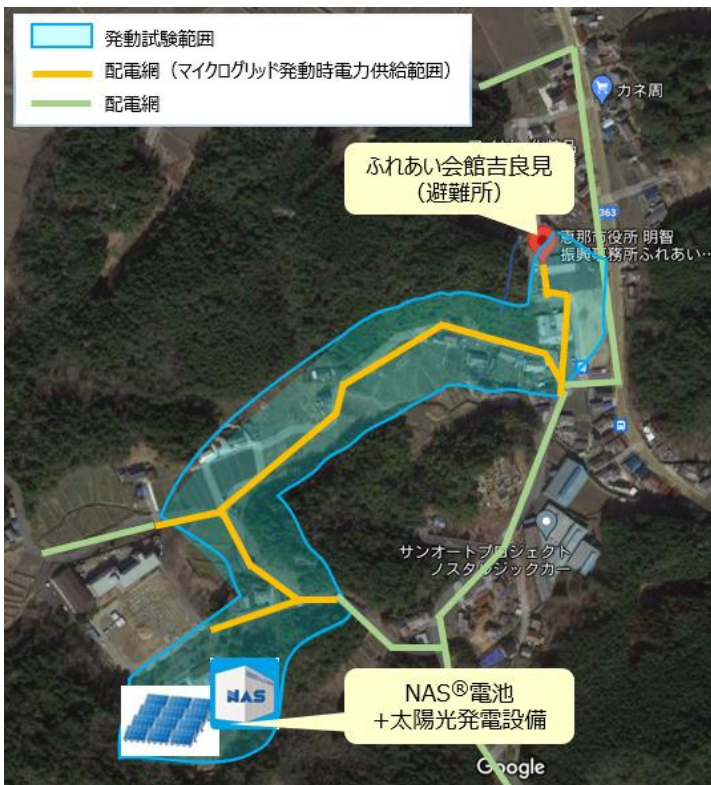
地域マイクログリッドの構築範囲(吉良見地区)